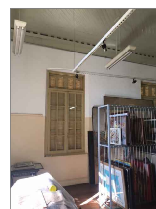
FOTO PIANCOTECA - PISO EM TABUA DE MADEIRA EM CORRIDA FORRO EM MADEIRA