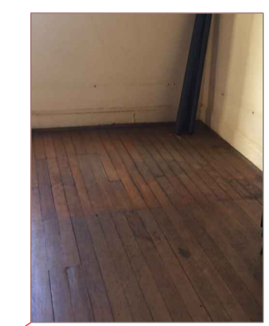
FOTO SALA RESERVA TECNICA - DANIFICADO E INSTALAÇÃO DE RIPAS NO MESMO PADRÃO