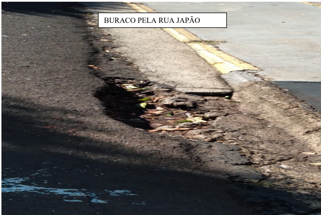
BURACO PELA RUA JAPÃO