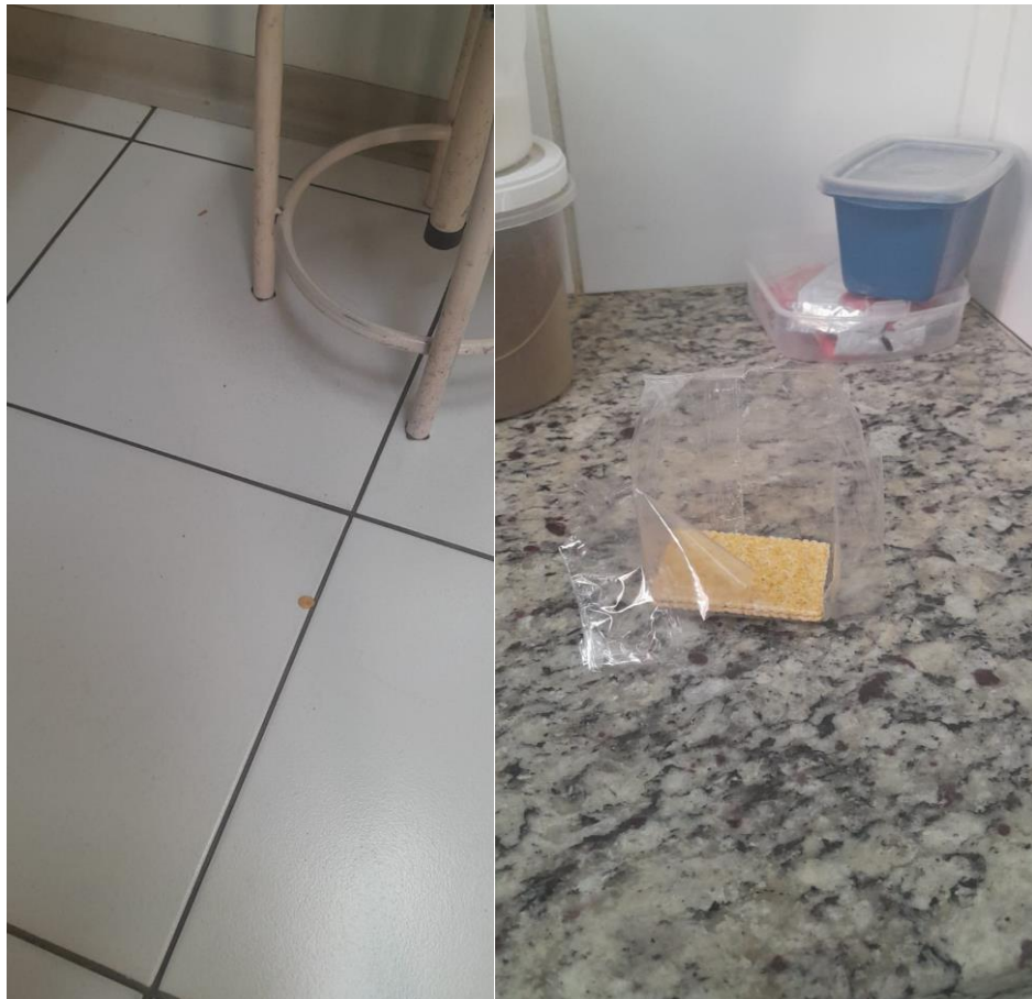
Foto: migalhas espalhadas e pacote de alimento aberto.

- O refeitório é um espaço comum onde compartilhamos refeições, e manter boas maneiras é essencial para garantir a harmonia e o bem-estar de todos. Seguir algumas regras simples de etiqueta faz toda a diferença no clima e na convivência com os colegas, evitando a presença de baratas, principal fonte de alimento dos escorpiões.