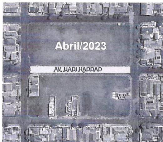
Situação em 2023 do atual local de realização das aulas de auto-escola para ônibus e carreta

Os moradores do trecho da Avenida Uadi Haddad entre a Rua Eng. José dos Santos e a Rua dos Bombeiros procuraram esta gerência para apontar para a ocorrência de conflito existente entre a atividade de aulas de autoescola em ônibus e carretas com o uso comum dos moradores. Até alguns meses atrás (ver imagem abaixo, em abril de 2023), o referido trecho não possuía casas construídas. A situação atual é da existência de 4 casas em construção com previsão de ocupação por seus proprietários ainda neste primeiro semestre de 2024.