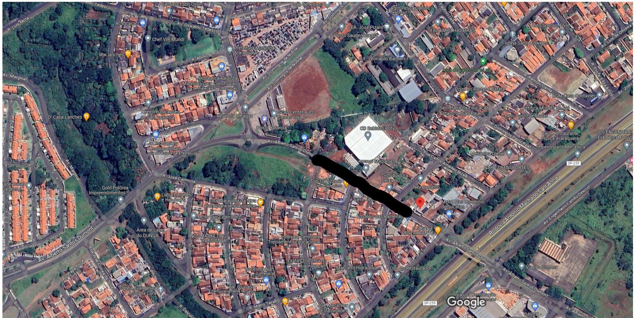
50 m