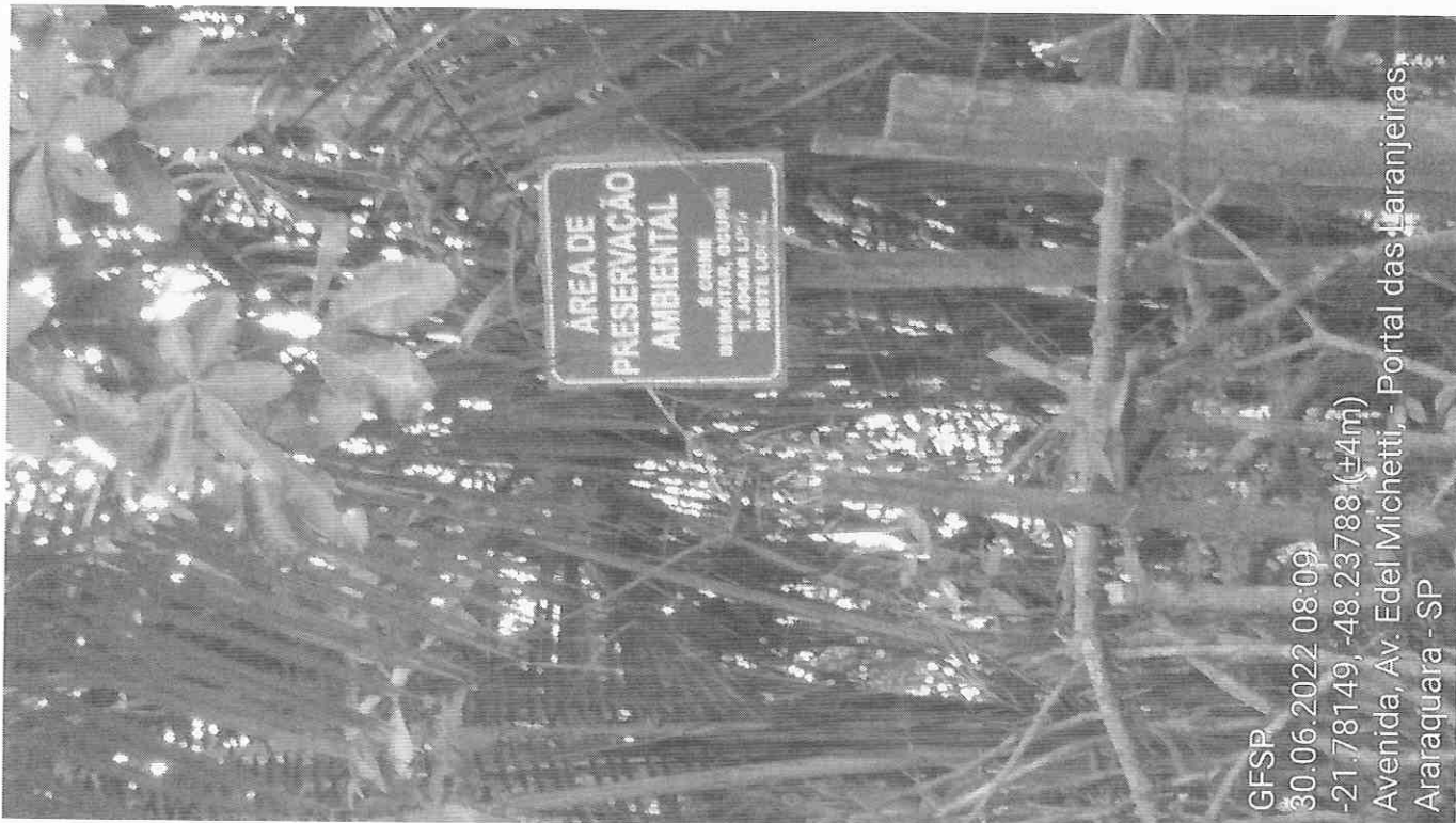
GFSP 30.06.2022 08:09 -21.78149, -48.23788 (±4m) Avenida, Av. Edel Michetti, - Portal das Laranjeiras, Araraquara - SP