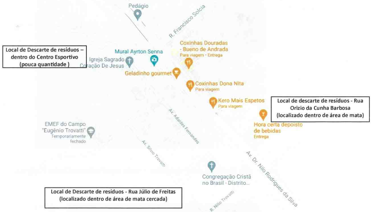
Imagem 07: croqui de localização dos pontos de descarte irregular de resíduos constatados