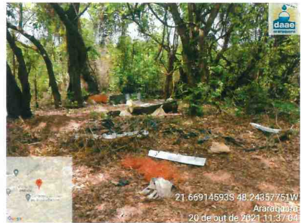
Imagens 03 e 04: Deposição irregular de resíduos em mata localizada no final da Rua Orizio da Cunha Barbosa