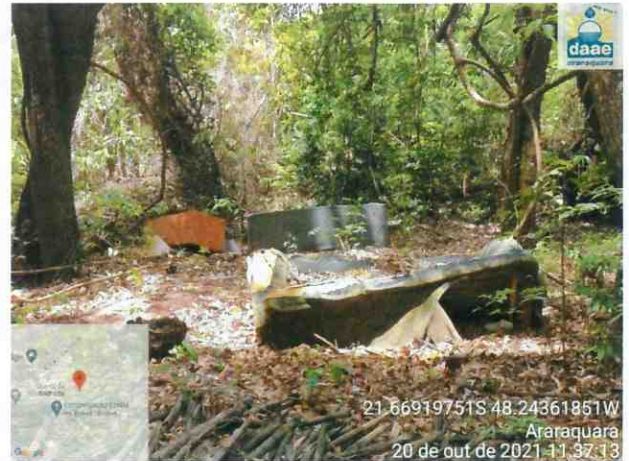
Imagens 01 e 02: Deposição irregular de resíduos em mata localizada no final da Rua Orizio da Cunha Barbosa