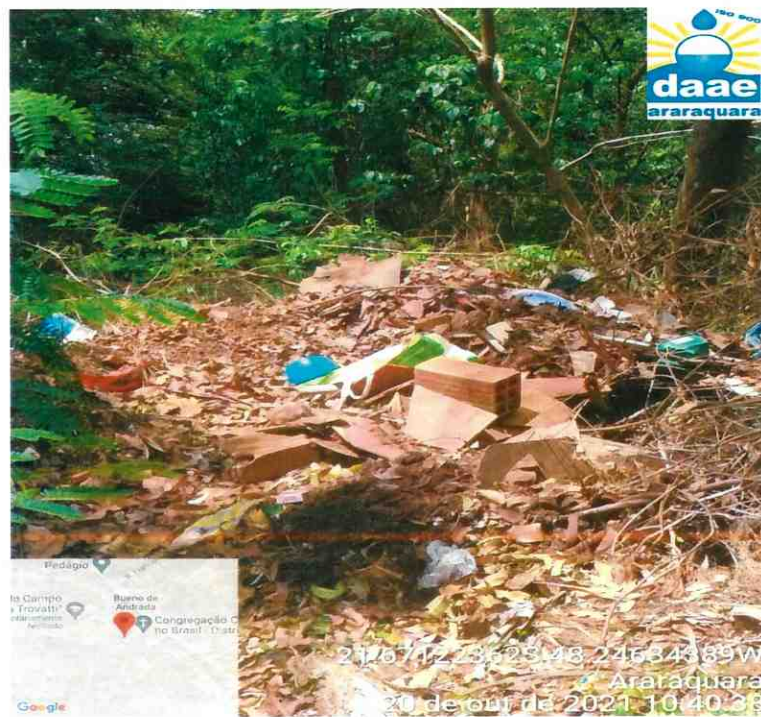
Imagem 06: Resíduos descartados em área de mata no final da Rua Júlio de Freitas