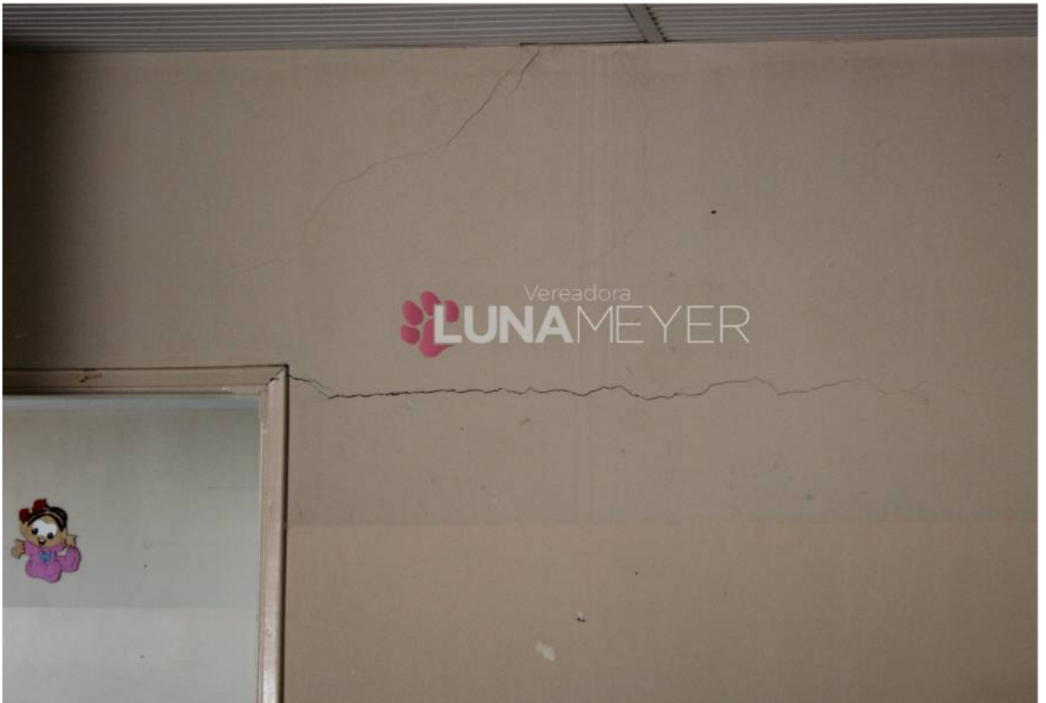
20/08 - Visita ao Distrito de Bueno de Andrada