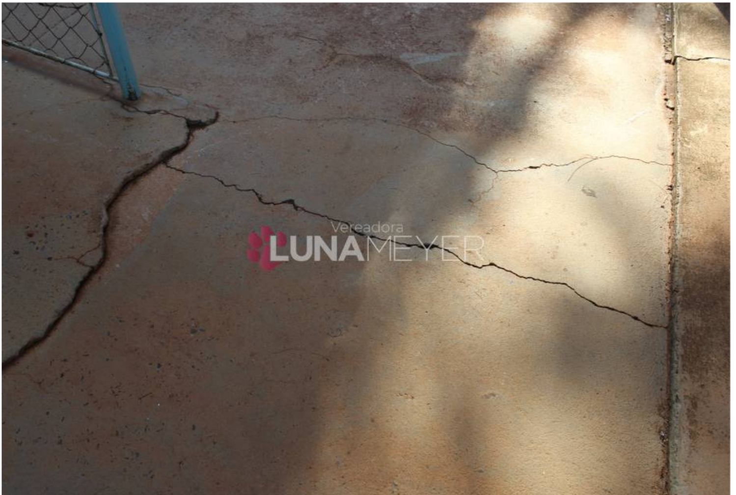
20/08 - Visita ao Distrito de Bueno de Andrada