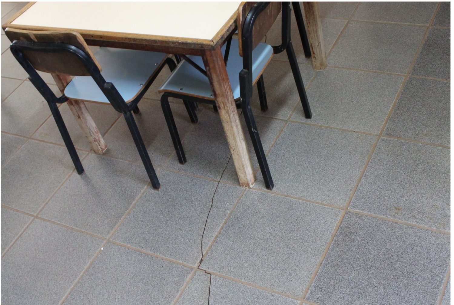
20/08 - Visita ao Distrito de Bueno de Andrada