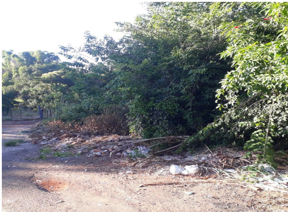
Cerca instaladas logo após as manilhas, desvirtuando a função social da via.