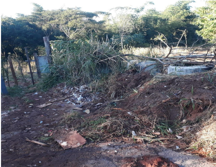
Manilhas que bloqueiam entrada da via.