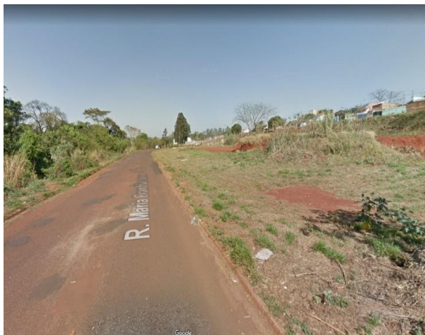
Condição da via após a obstrução - situação que se perpetua desde 2019.