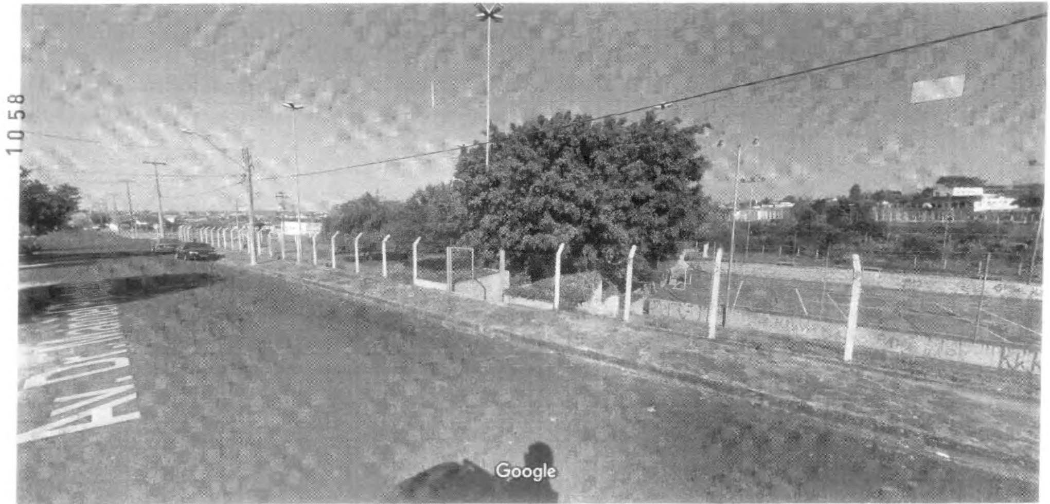
Captura da imagem: ago. 2011