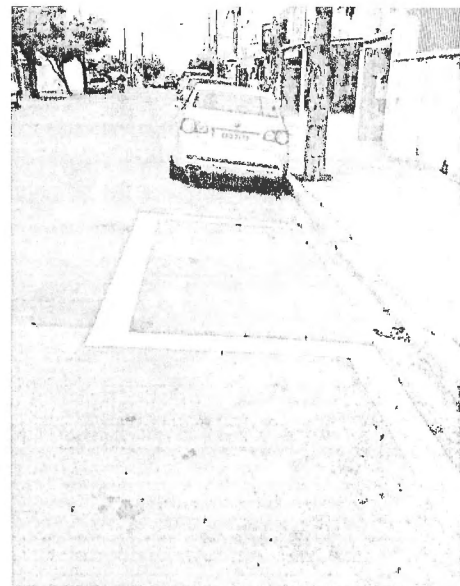
Depois da pintura da linha amarela