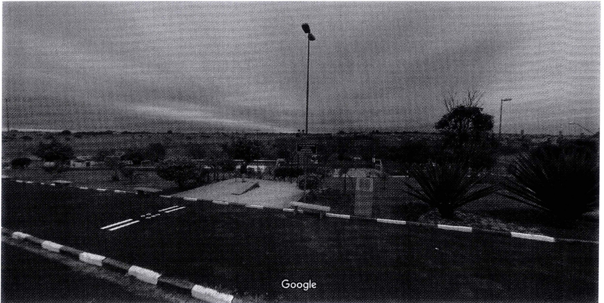
Captura da imagem: ago 2011