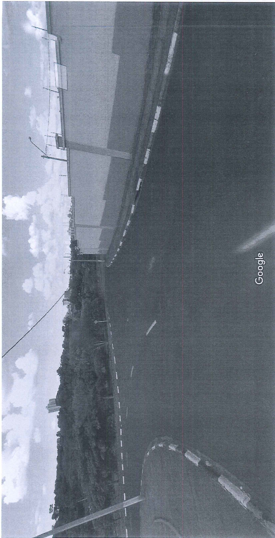
Captura da imagem: jun 2012