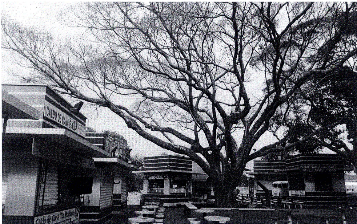
Vista geral do exemplar, totalmente seco.