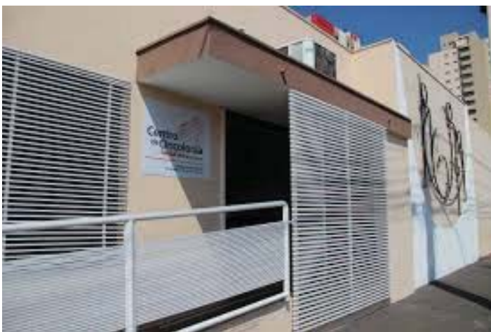
Setor oncológico da Santa Casa de Araraquara

Em junho passado, a Estapar, em parceria com a Prefeitura de Ara-