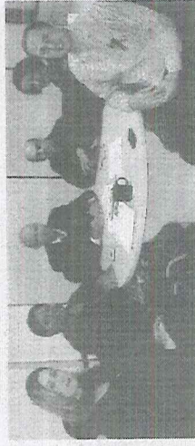
Empresa Amiga do Surdo