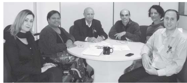
Empresa Amiga do Surdo