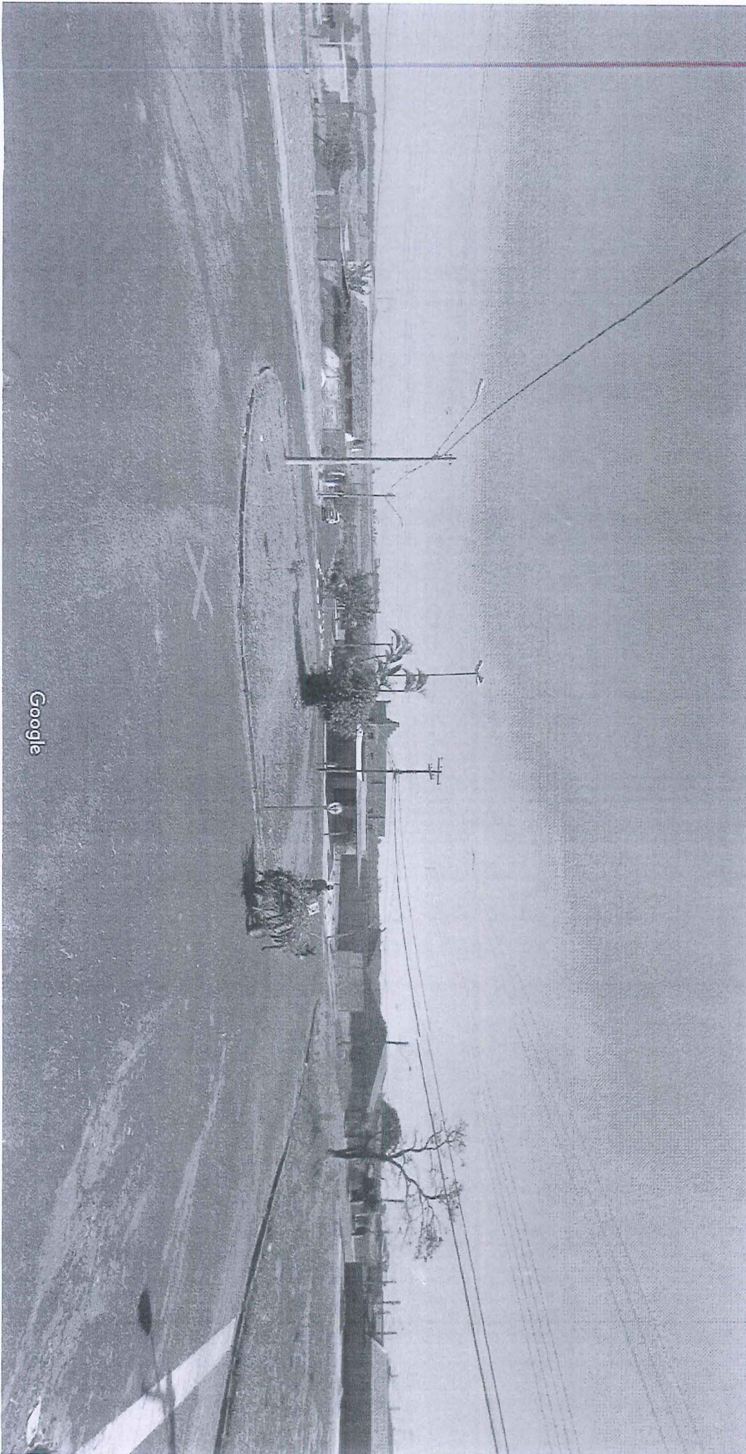
Captura da imagem: ago 2011