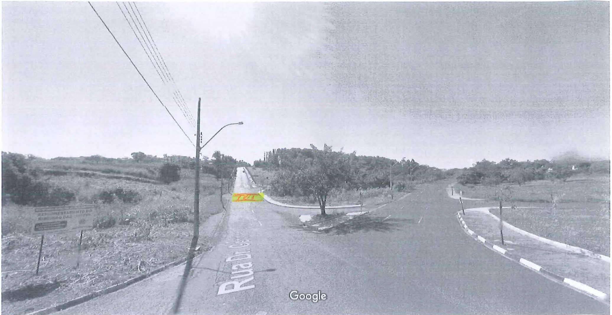
Captura da imagem: jun 2012