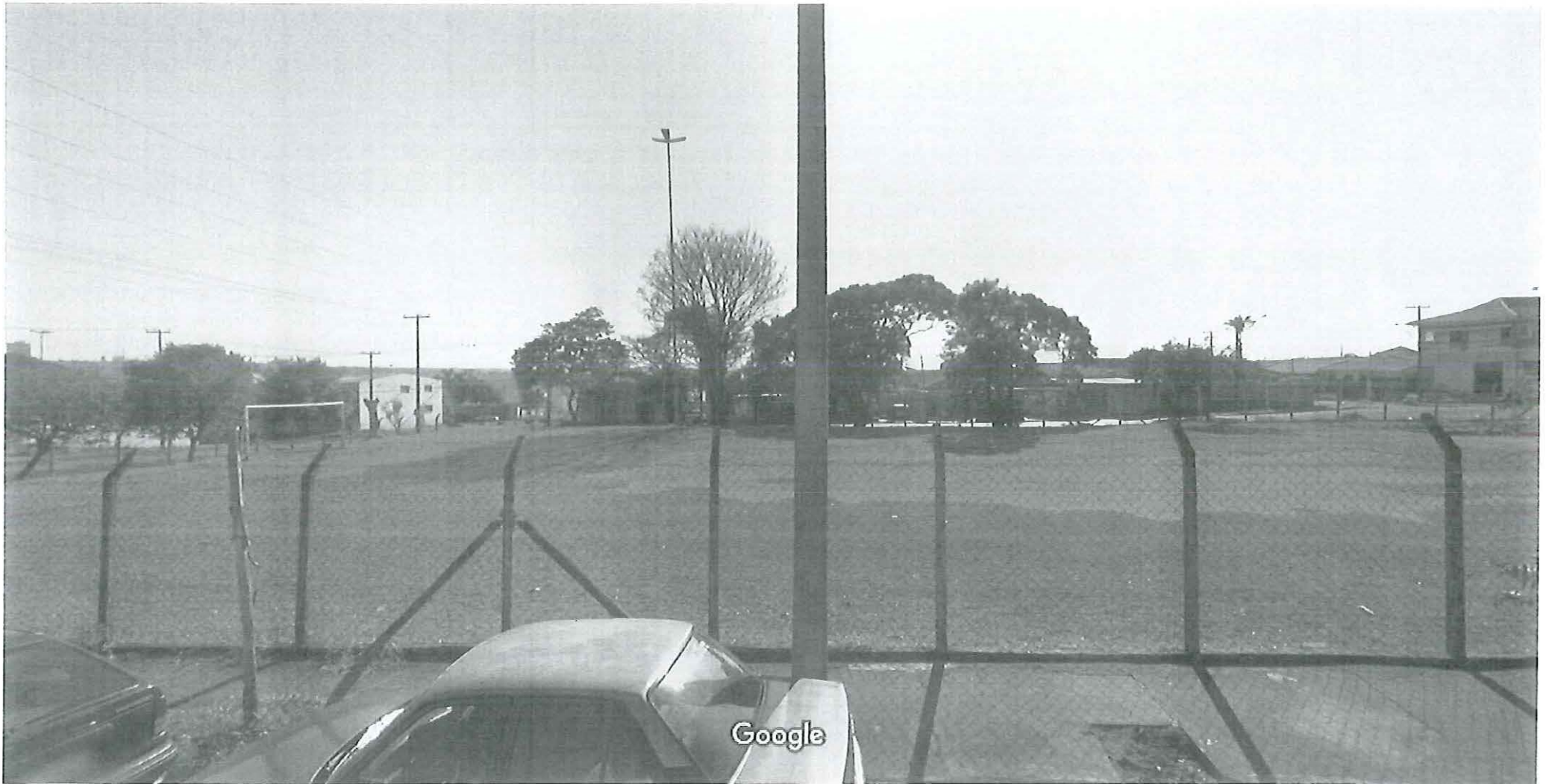
Captura da imagem: ago 2011 © 2018 Google