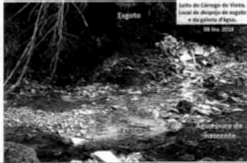
Letto do Córrego do Valeiro. Local de despejo de esgoto e de galeria d'água. 20 Jan. 2012