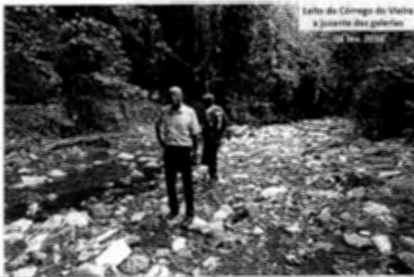
Letto do Córrego do Valeiro e Janela das galerias 20 Jan. 2012