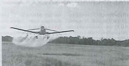
Proibição da pulverização aérea de agrotóxicos é votada na câmara hoje

De acordo com dados da Agência Nacional de Vigilância Sanitária (Anvisa),