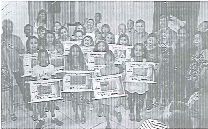
Alunos de Santa Lucia são premiados em concurso

Foram dezenas de trabalhos apresentados, com a participação de mais de 400 alunos da rede pública. Durante três meses professores e diretores tiveram orientações sobre o trabalho com os alunos para que pudessem participar do concurso sob a temática: "O Papel da Família na Prevenção ao uso de drogas". "A nossa equipe não en-