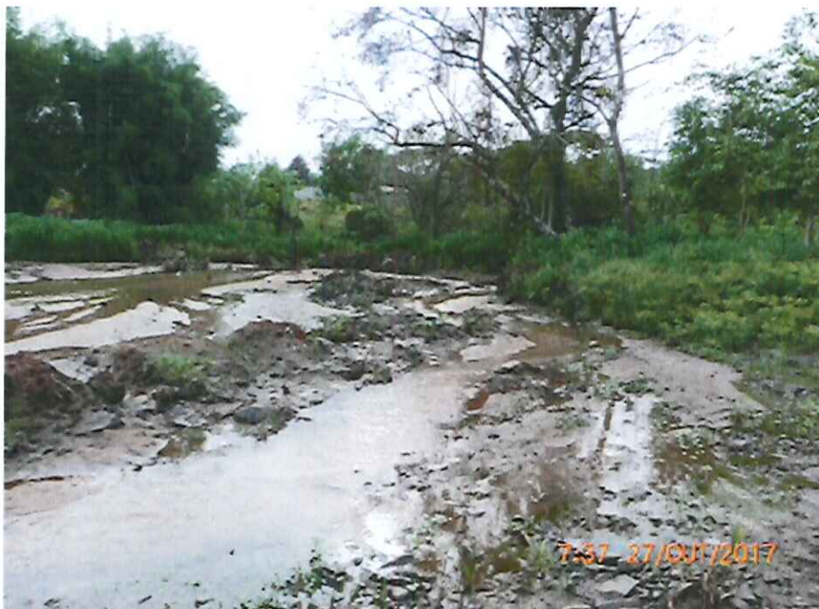
Foto 3: Vista do leito assoreado do Córrego do Serralhal e dos particulados sólidos carreados em parte da obra da travessia e loteamento Campos de Piemonte