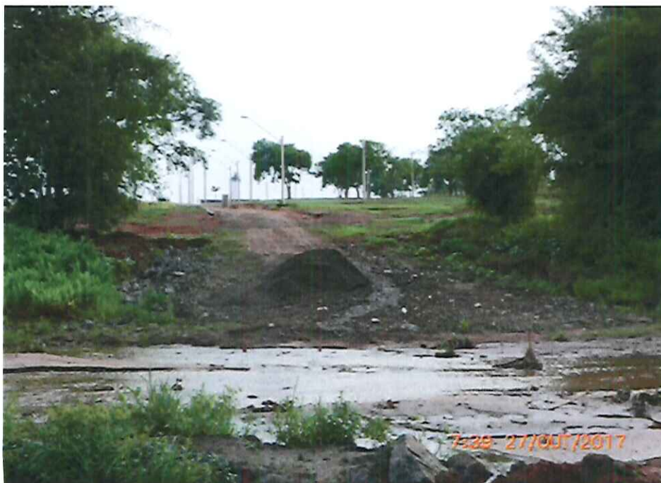
Foto 2: Vista do leito assoreado do Córrego do Serralhal no ponto da Travessia e ao fundo uma via não pavimentada do Loteamento Residencial Campos de Piemonte