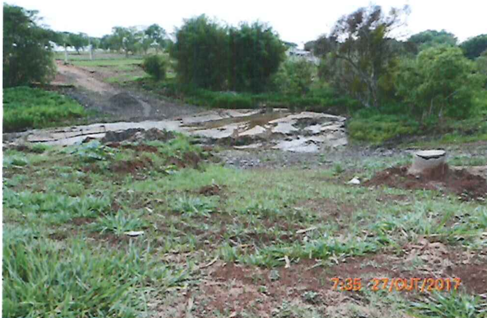
Foto 1: Vista do leito assoreado do Córrego do Serralhal no ponto da Travessia