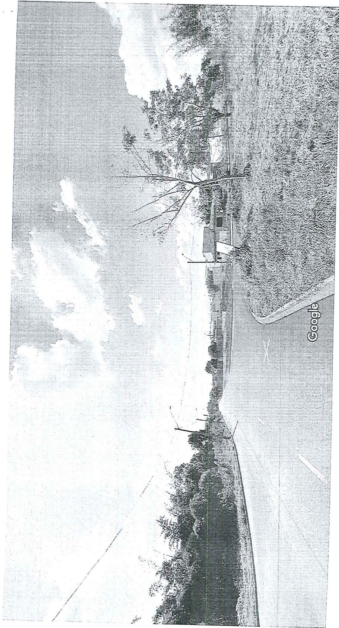
Street View - jun 2012