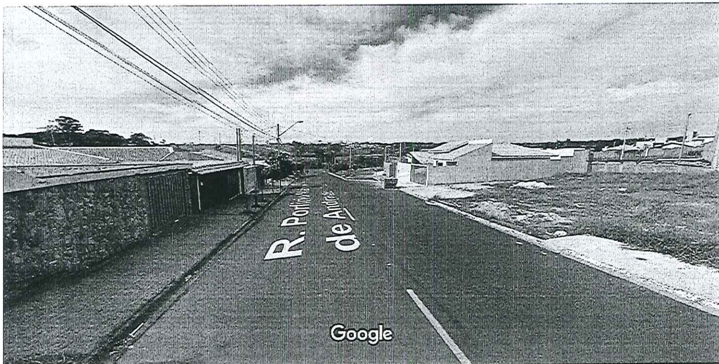
Captura da imagem: jun 2012 © 2017 Google