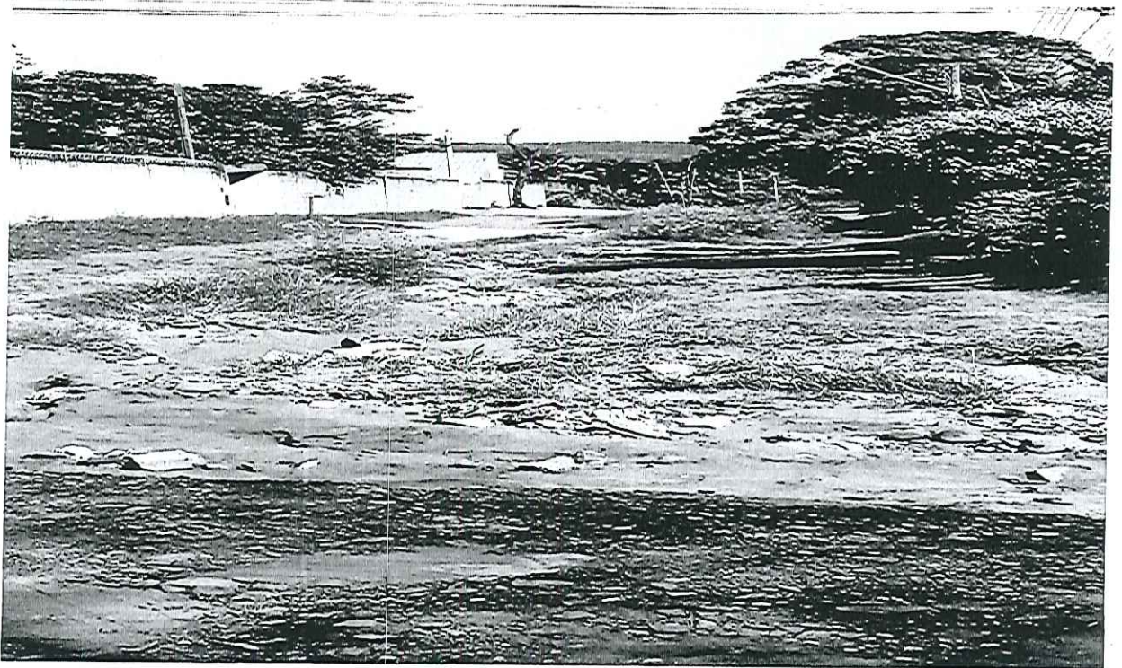
009-3 Buracos Avenida José Sitta Filho, No Jardim Zavanella