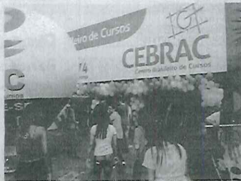
Evento acontece amanhã (15) na praça Santa Cruz

Durante o evento serão oferecidos diversos serviços à população: Emissão de carteiras de trabalho pelo PAT; Cadastro de jovens para estágio e aprendizagem pelo CIEE; Assistência Jurídica gratuita pela OAB; Orientação sobre saúde mental pelos profissionais do Hospital Cairbar Schutel; Elaboração de currículo, teste vocacional e vagas de emprego pela Agência de Empregos Cebrac.