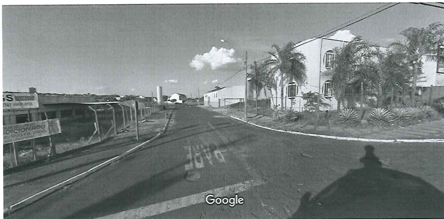
Captura da imagem: abr 2016