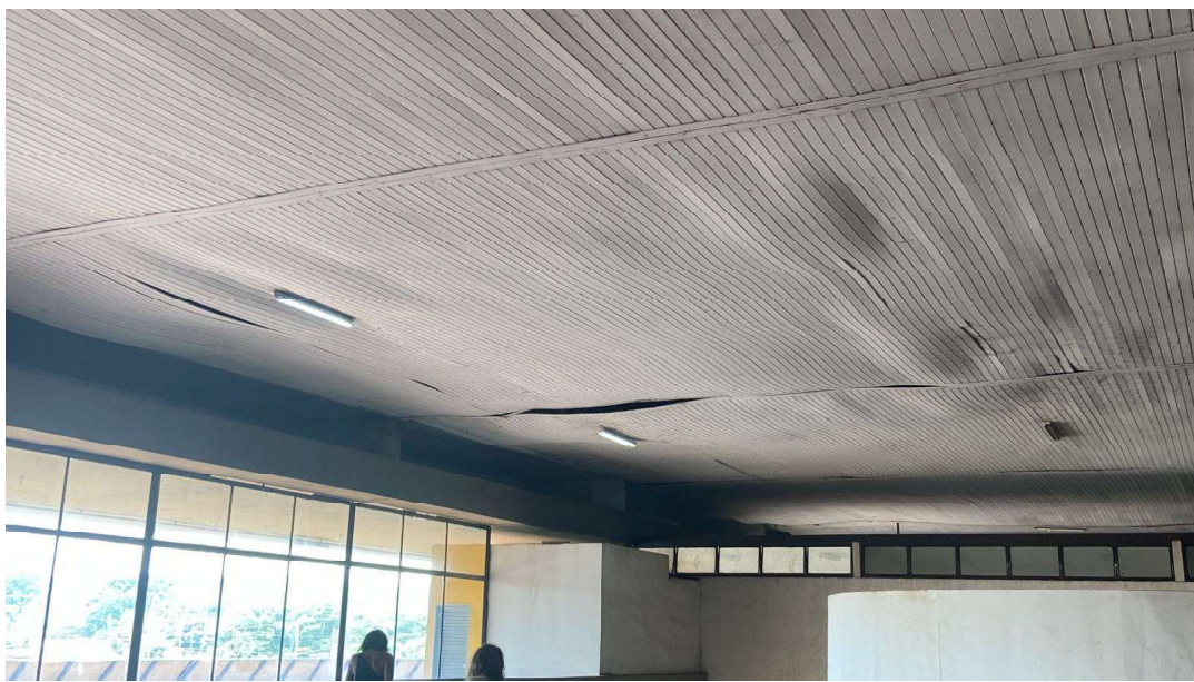
Abertura na rampa do lado da empresa Cruz