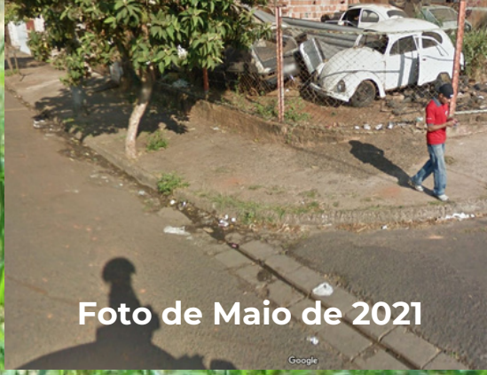
Foto de Maio de 2021