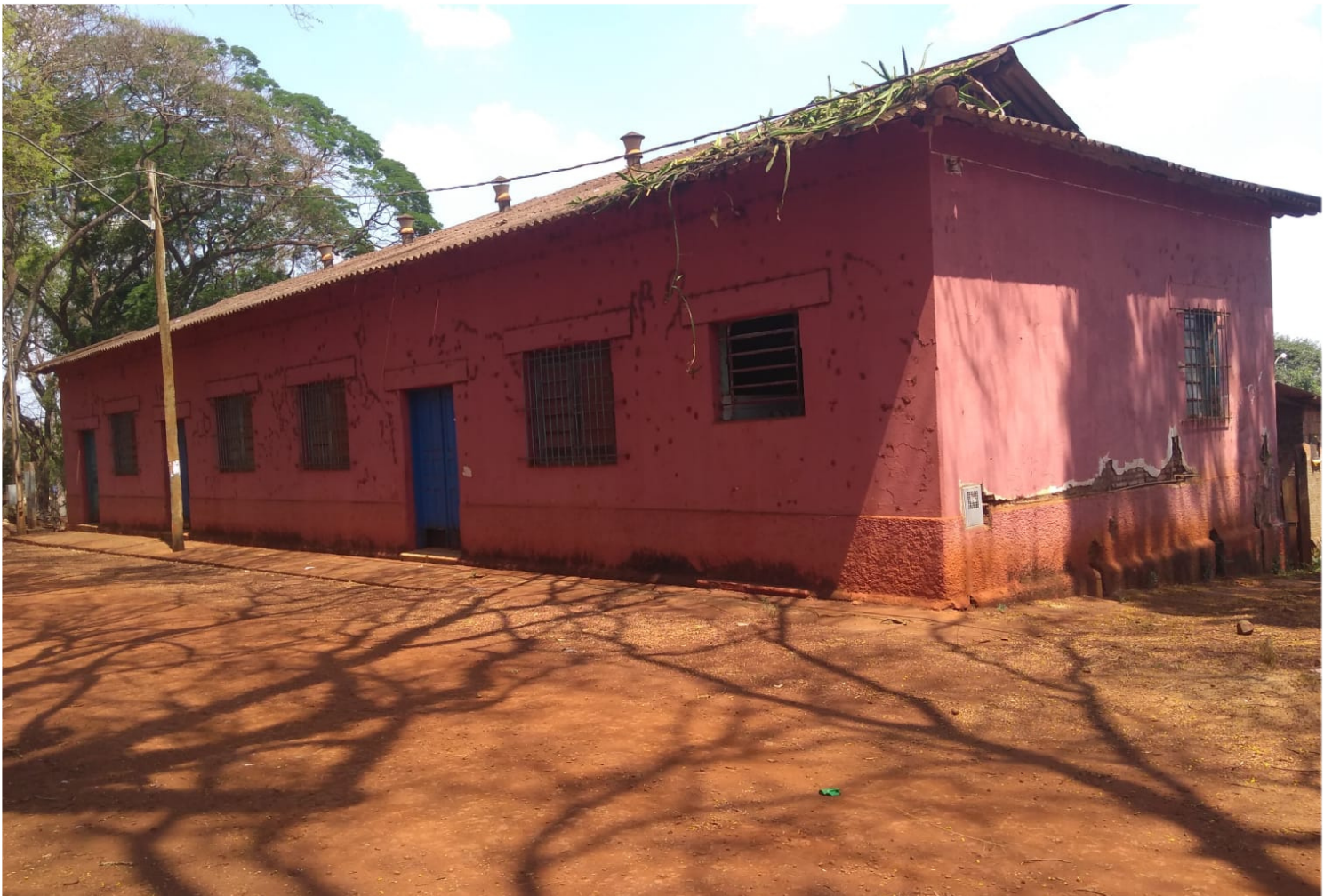
23/09 - Salão comunitário - Assentamento Bela Vista