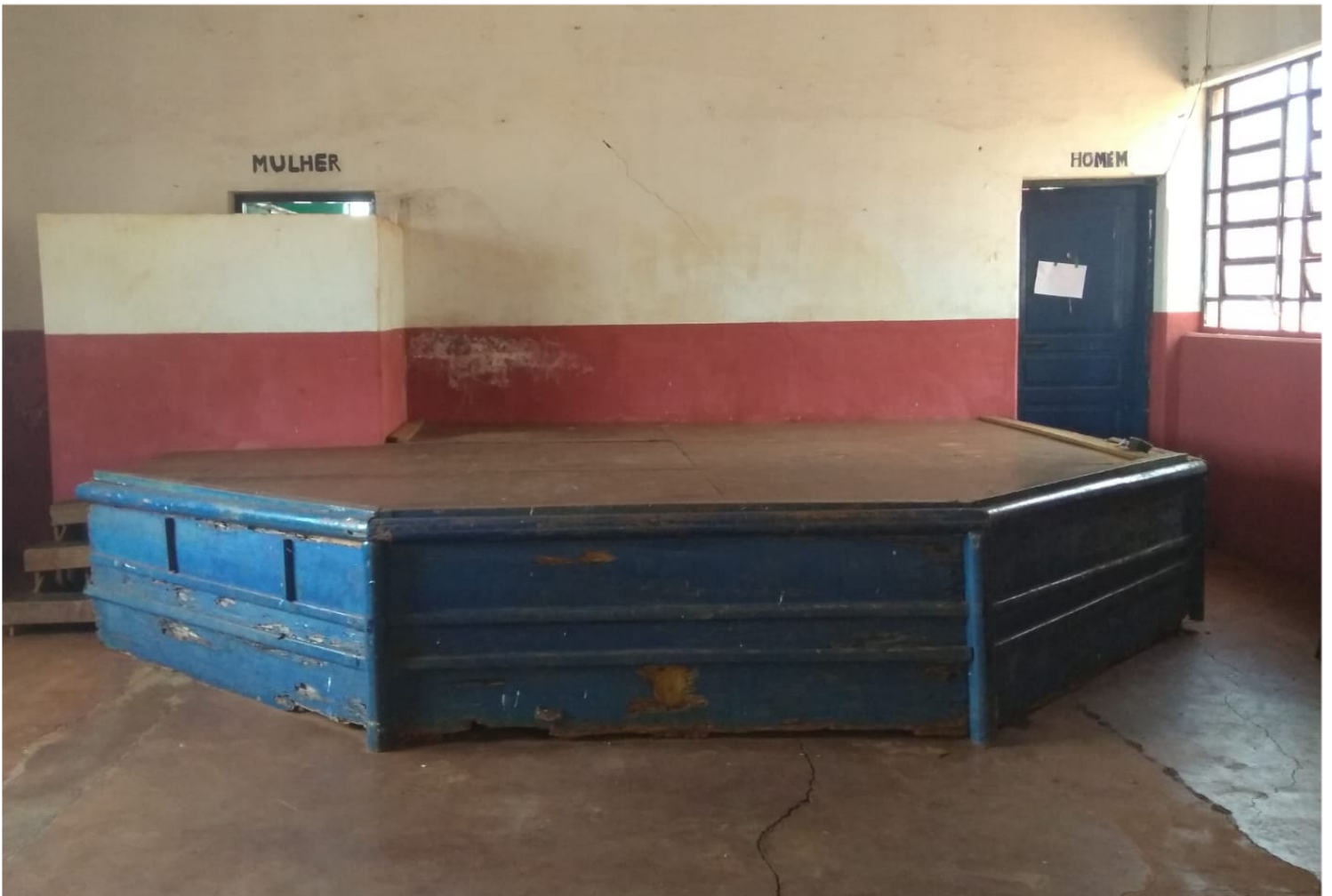
23/09 - Salão comunitário - Assentamento Bela Vista