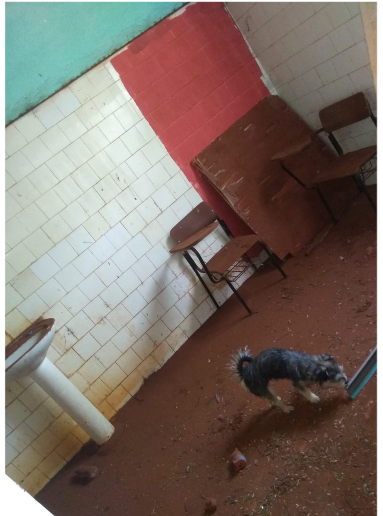
23/09 - USF - Assentamento Bela Vista