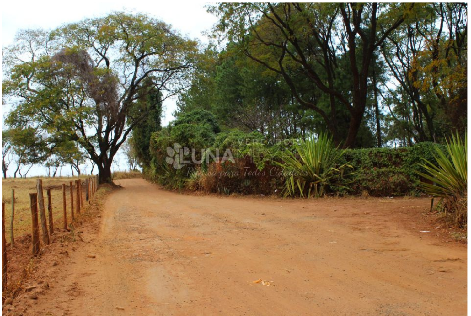
06/08 - Visita ao bairro Recanto dos Nobres