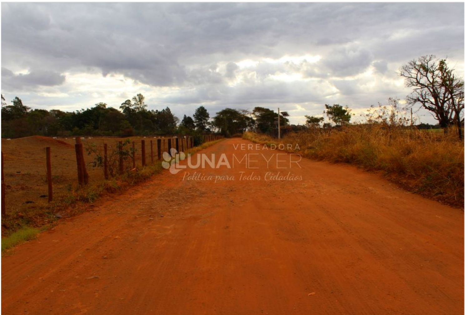
06/08 - Visita ao bairro Recanto dos Nobres