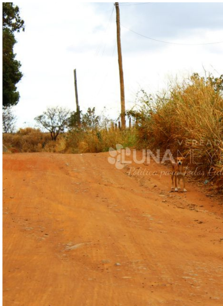
06/08 - Visita ao bairro Recanto dos Nobres