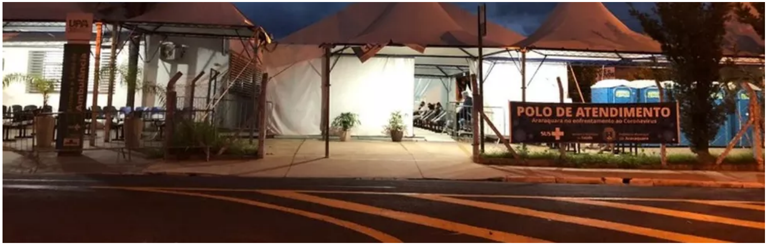
UPA da Vila Xavier atende pacientes com sintomas de Covid-19 em Araraquara

Segundo a nota, a equipe médica constatou baixa saturação e, diante do quadro que se agravou no período, imediatamente acionou a Central de Regulação de Oferta de Serviços de Saúde (Cross). Enquanto aguardava um retorno, encaminhou a paciente para a sala de emergência, que possui estrutura de UTI, já que houve a necessidade de intubação.