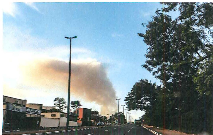
Queimadas aumentam em Araraquara

O número de queimadas em áreas urbanas de Araraquara subiu 108% no primeiro semestre de 2020, em relação ao mesmo período do ano passado. De janeiro a junho deste ano foram 417 registros em comparação as 200 queimadas registradas em 2019, segundo um levantamento feito pelo Departamento Autônomo de Água e Esgoto (Daae), a pedido do ACidadeON .