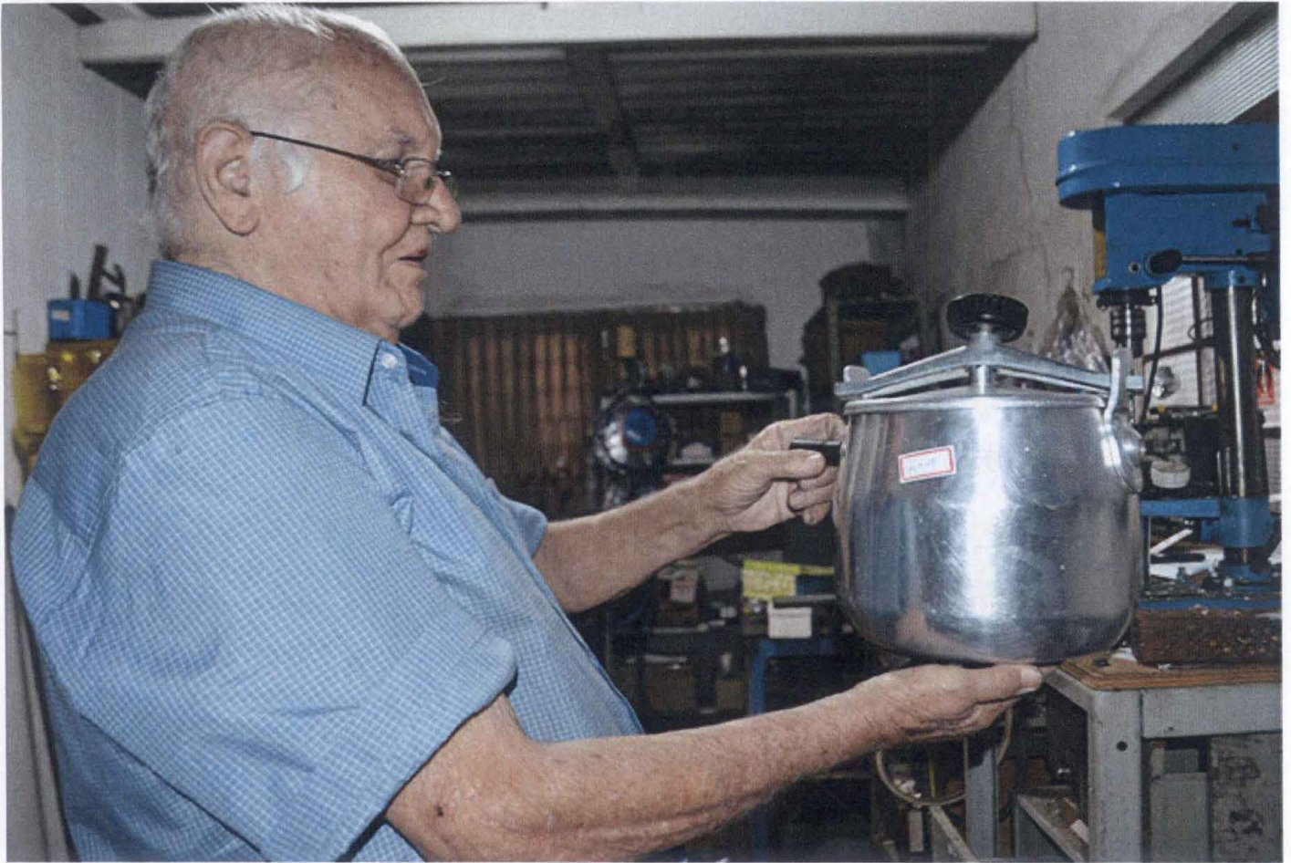
Panelas antigas ou modernas, saem como novas