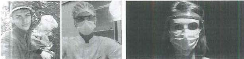
Jovem deixa trabalho na roça para estudar Biocitologia na Unesp de Araraquara