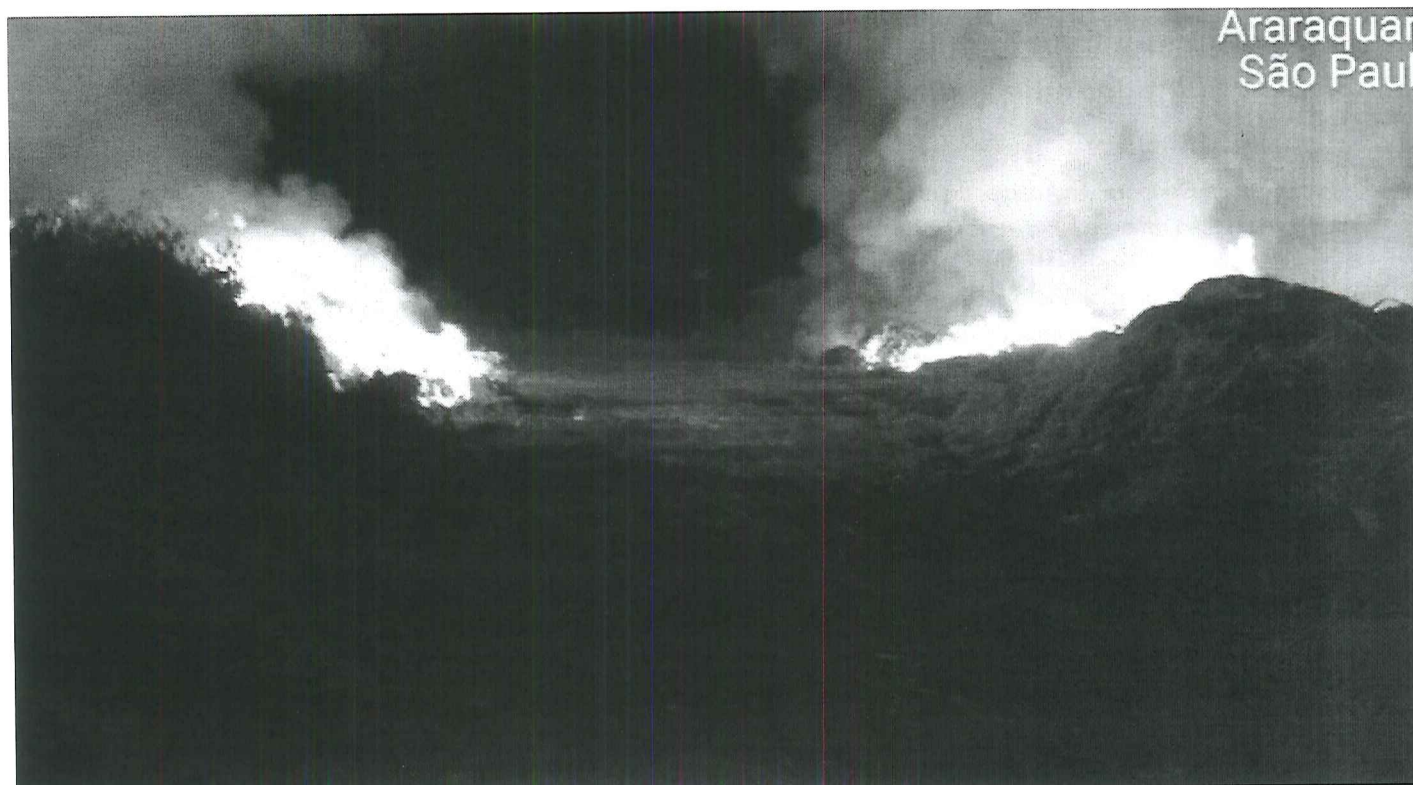
Incêndio na área de resíduos de construção do Daae no Jardim Pinheiros

Um incêndio será investigado pela polícia. O caso aconteceu na noite do último sábado (28) na Área de Triagem e Transbordo na Estação de Tratamento de Resíduos da Construção Civil (ETRCC), que fica no Jardim Pinheiros, Zona Leste de Araraquara. O local é administrado pelo Departamento Autônomo de Água e Esgoto (Daae).