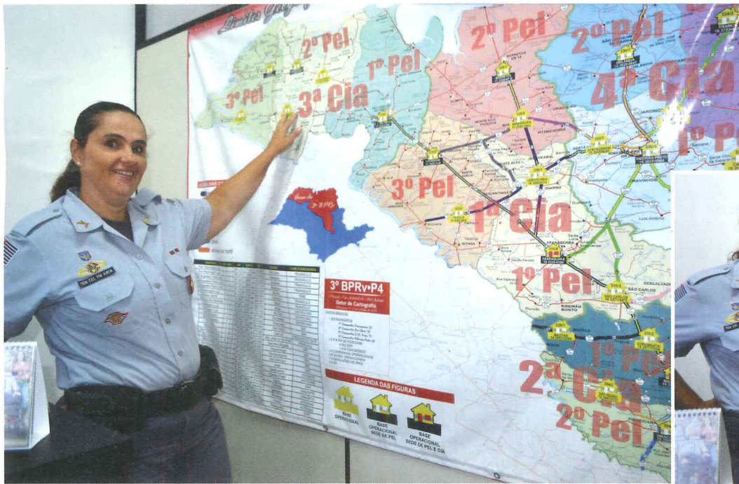
Na história da Polícia Militar Rodoviária em Araraquara a primeira mulher a ocupar um posto de comandante