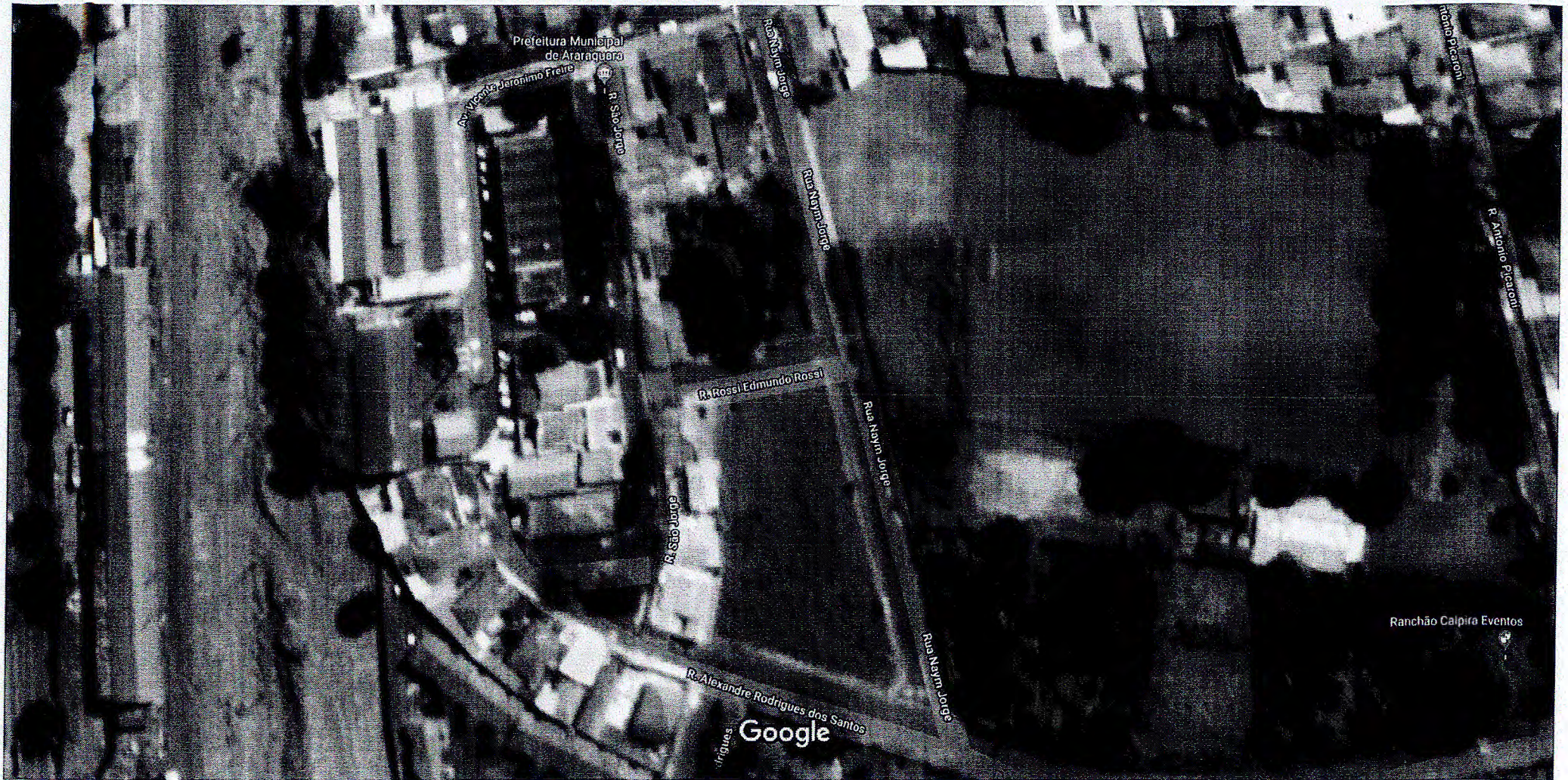
Imagens ©2019 DigitalGlobe, Dados do mapa ©2019 Google 20 m