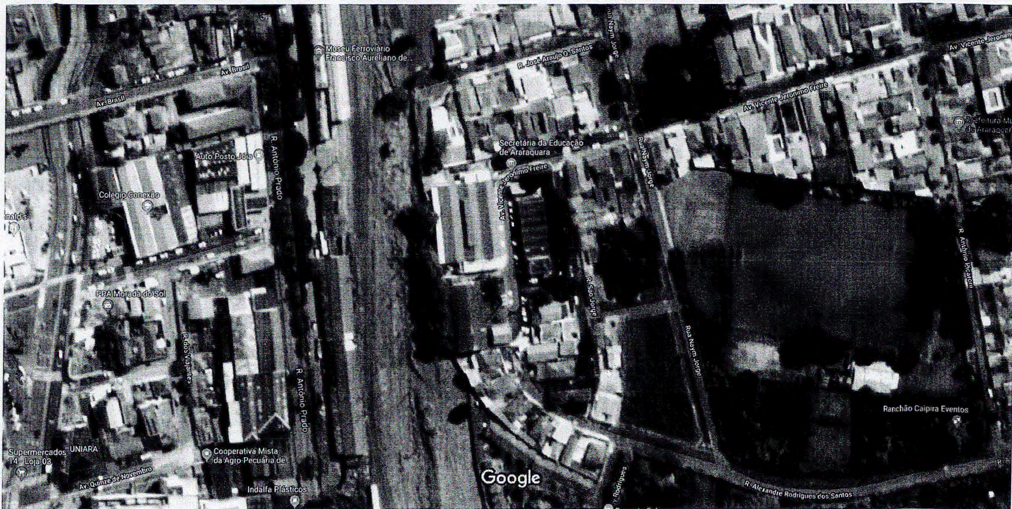
20 m