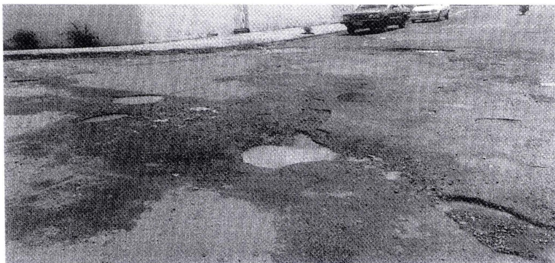
Avenida Lazaro Rodrigues Braga