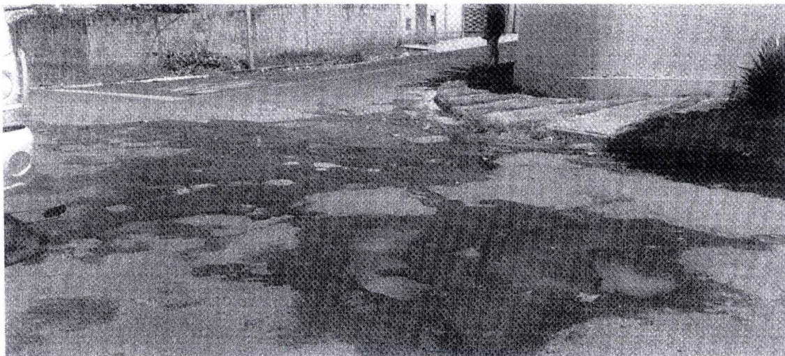
Avenida Eugênio João Faccio