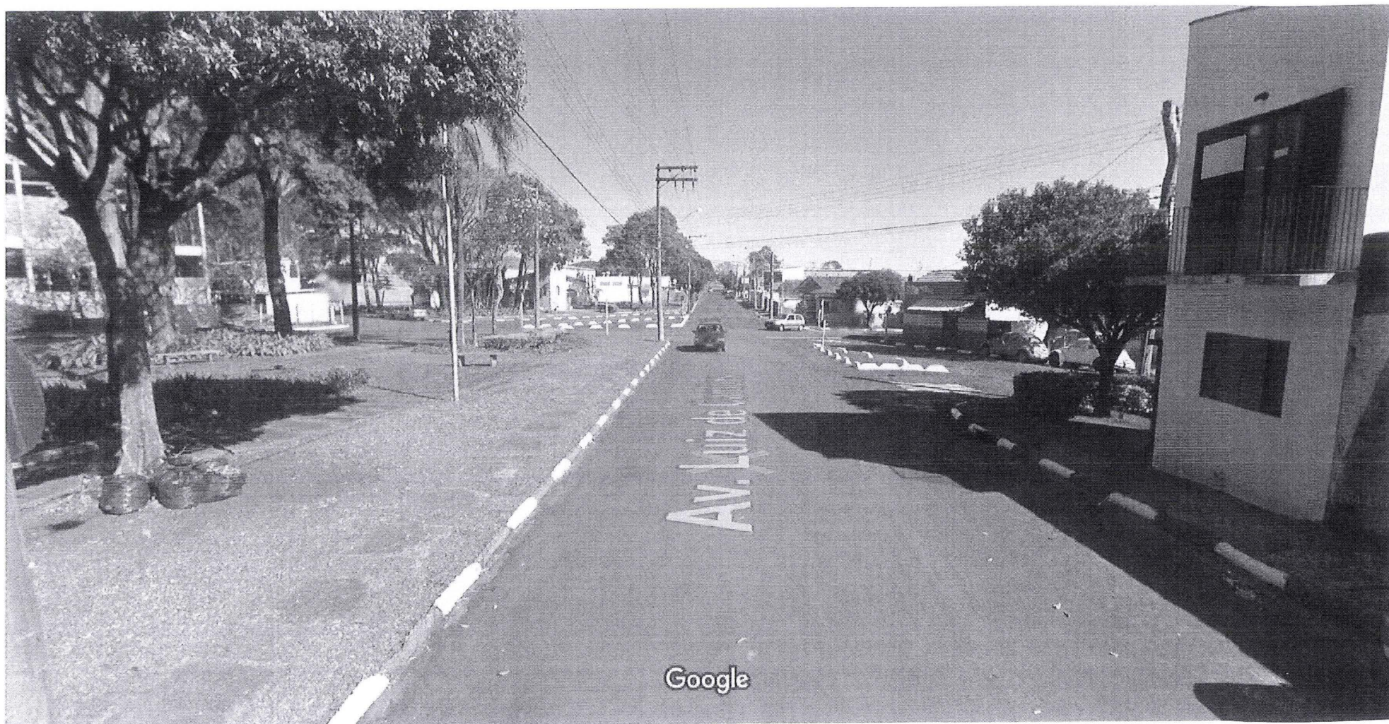
Captura da imagem: ago 2011