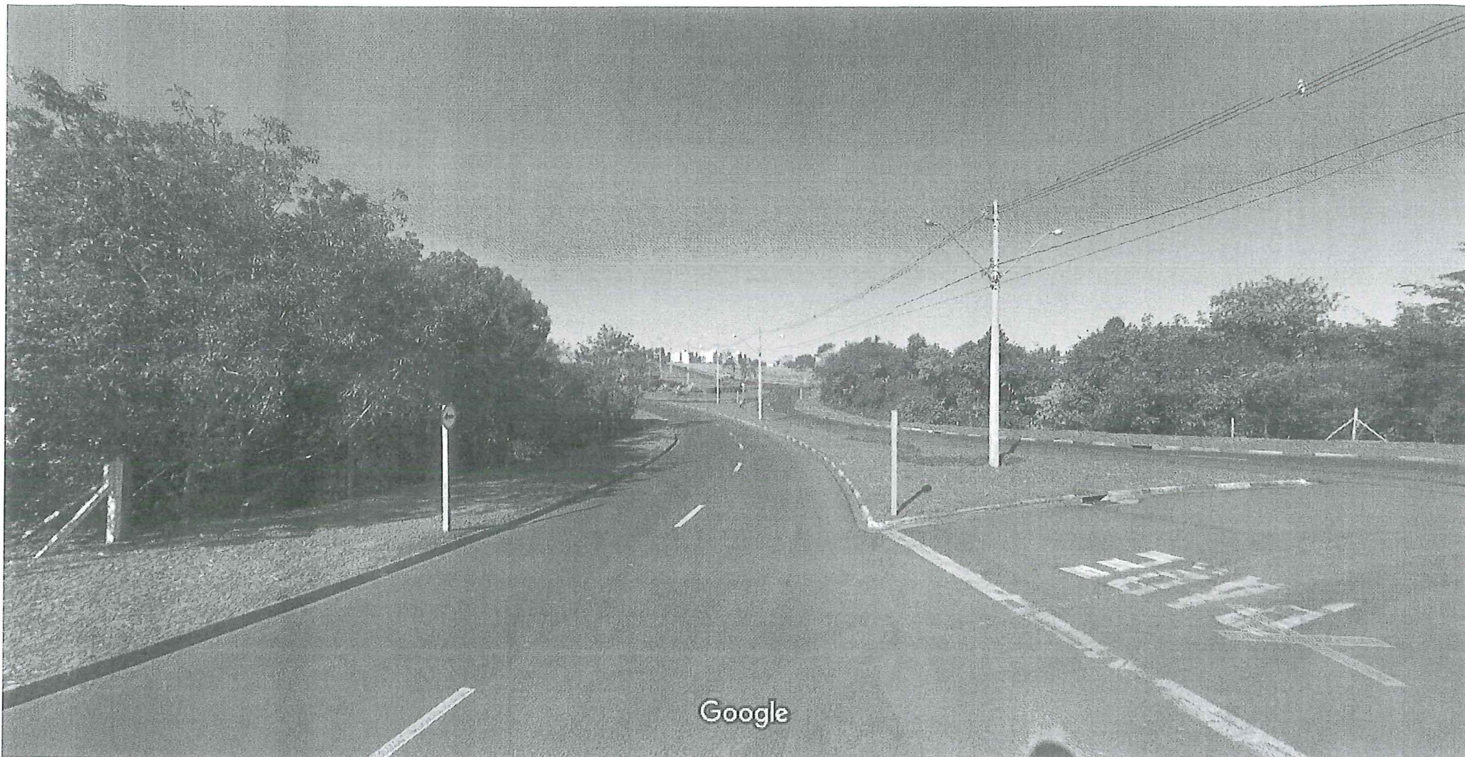
Captura da imagem: ago 2011