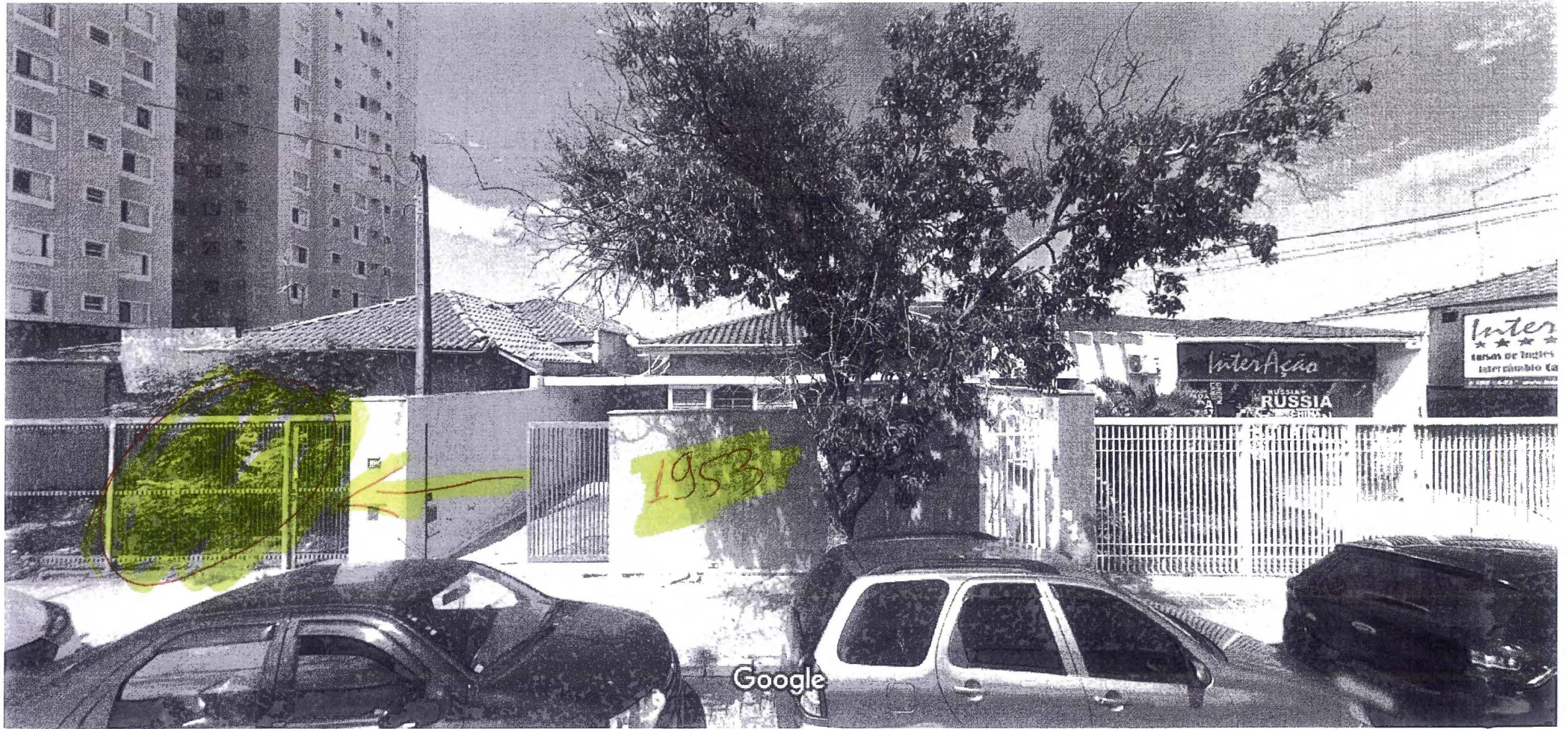
Captura da imagem: dez 2017