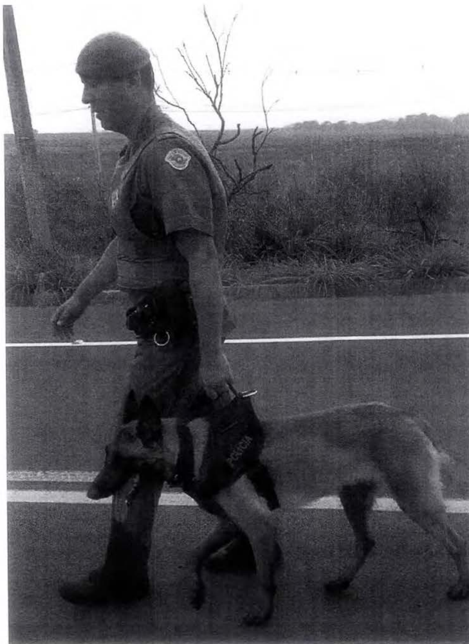
Mais de 60 policiais militares participaram da operação

Outras cinco pessoas já tinham sido detidas durante a investigação iniciada meses atrás pelo Gaeco. O alvo era uma região específica da cidade onde foram apreendidas mais de 35% do volume de drogas de todo o município.