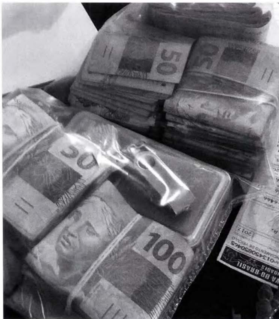
Dinheiro apreendido durante a operação em Araraquara