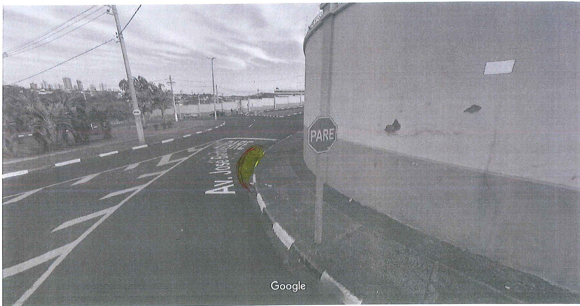
Captura da Imagem: ago 2011 © 2018 Google