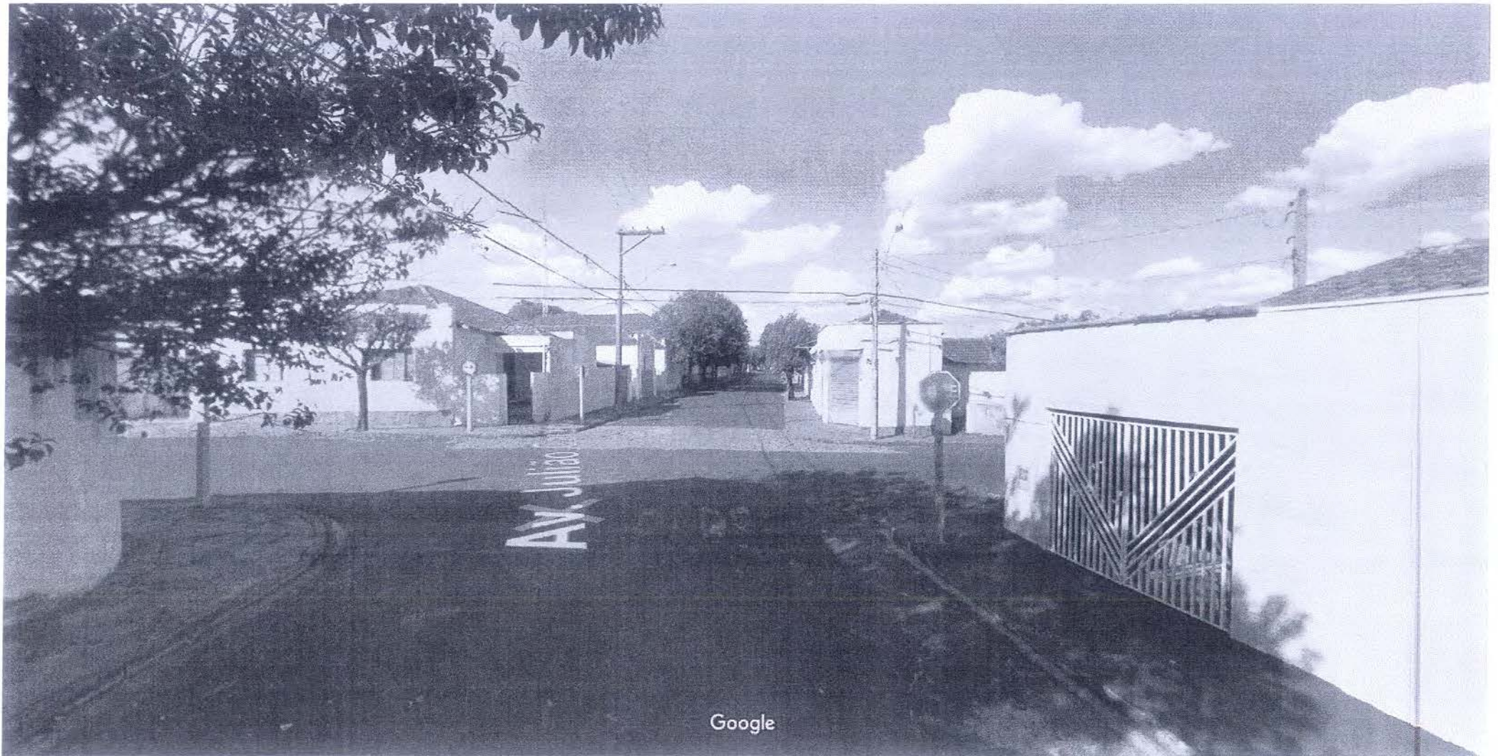
Captura da imagem: ago 2011 © 2018 Google