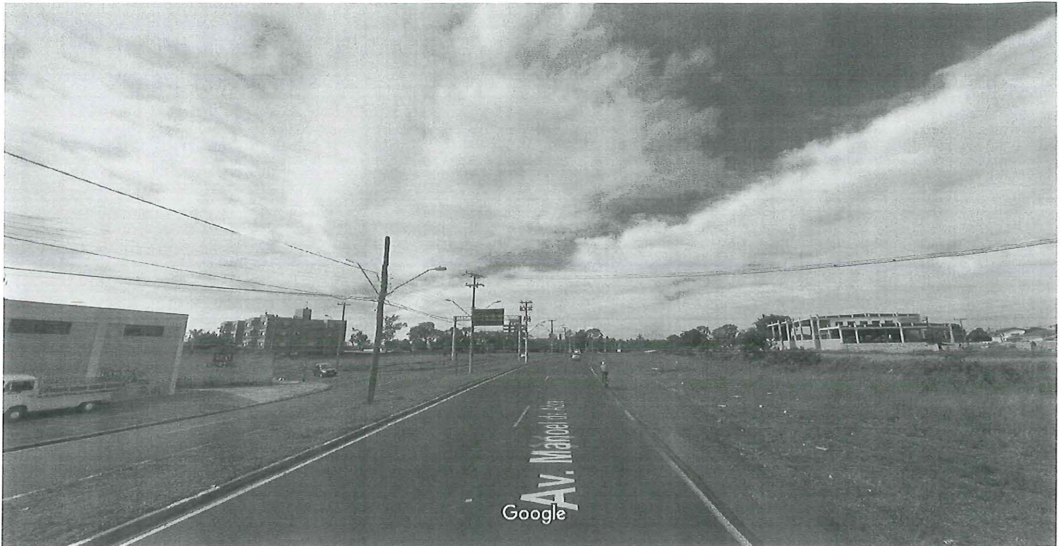
Captura da imagem: jun 2012