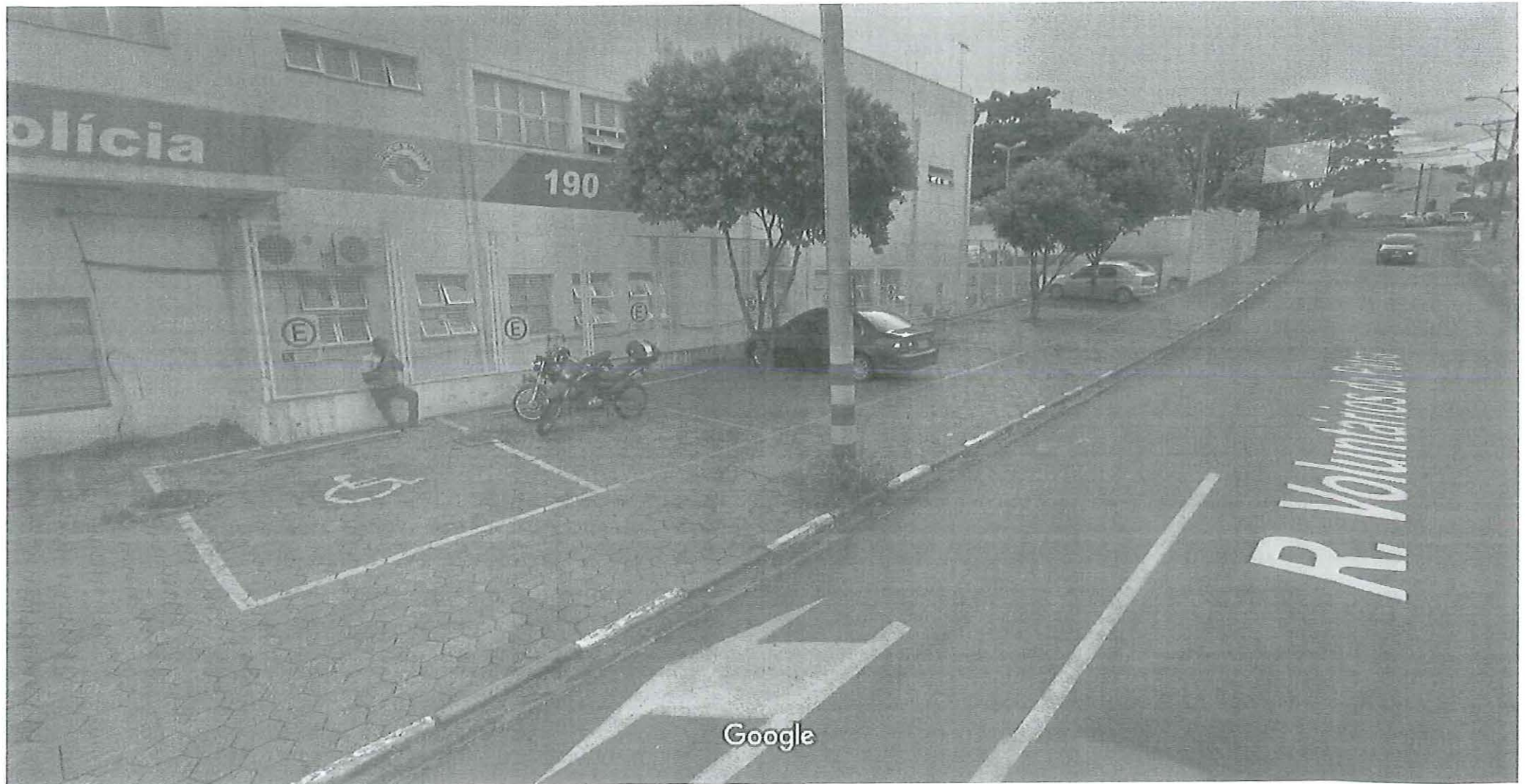
Captura da imagem: mar 2017