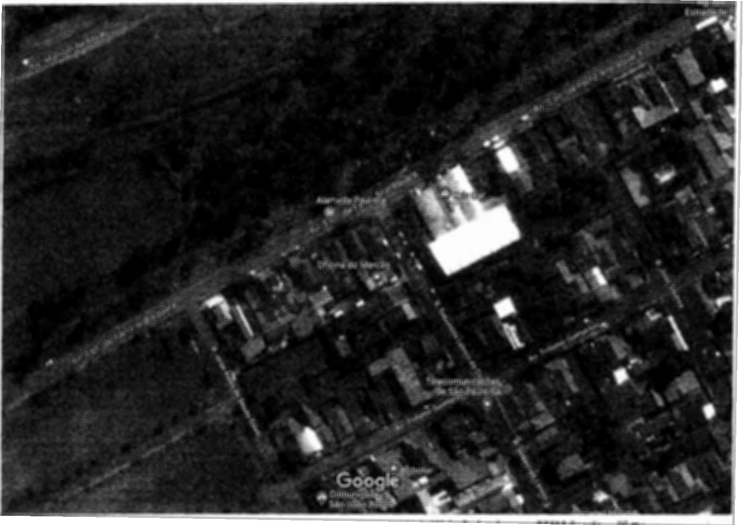
Imagens ©2018 DigitalGlobe, Dados do mapa ©2018 Google 20 111